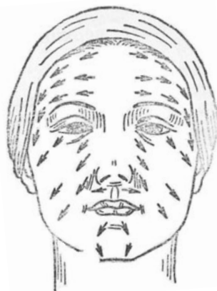
Направление движения при массаже лица

В качестве мягкой альтернативы насадки для КУВТ использовать по правилам для этой насадки.